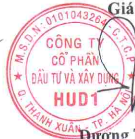
Đương Tất Khiêm